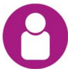
Den enkelte ansatte

Den enkelte ansatte skal tage et aktivt medansvar for at sikre et godt arbejdsmiljø, og skal medvirke til trivsel og godt arbejdsmiljø på arbejdspladsen.