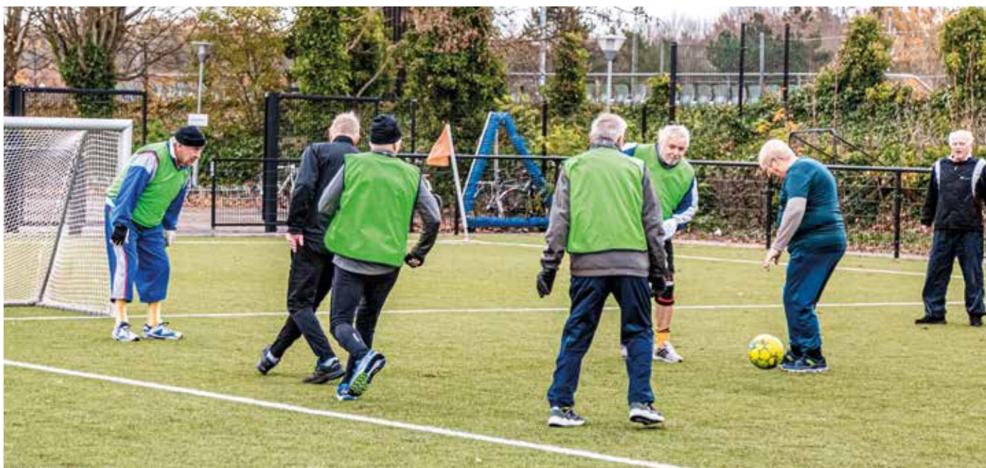
Der er Gå-fodbold hver tirsdag ved Vallensbæks Idrætscenter. Du møder bare op.

En træning består af en kort opvarmning, og herefter spilles der 2 gange 25 minutter, hvor mændene er delt op på to hold af cirka 4-6 spillere på hver. Efter træningen er det tid til tredje halvleg, hvor der bliver drukket en øl på banen eller i omklædningsrummet og vendt løst og fast.