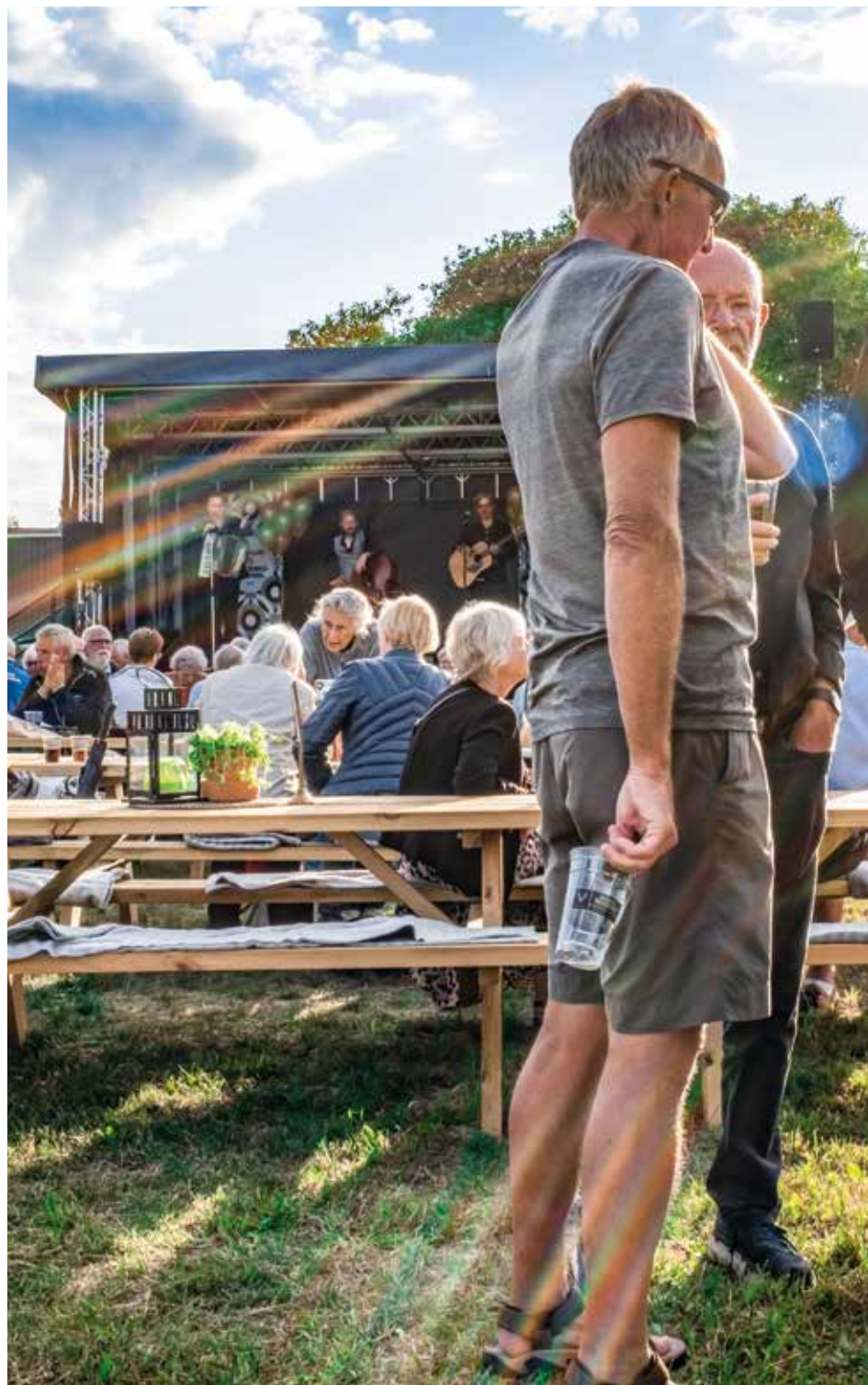
I år blev Vallensbæks frivillige fejret med en festival i Strandparken.