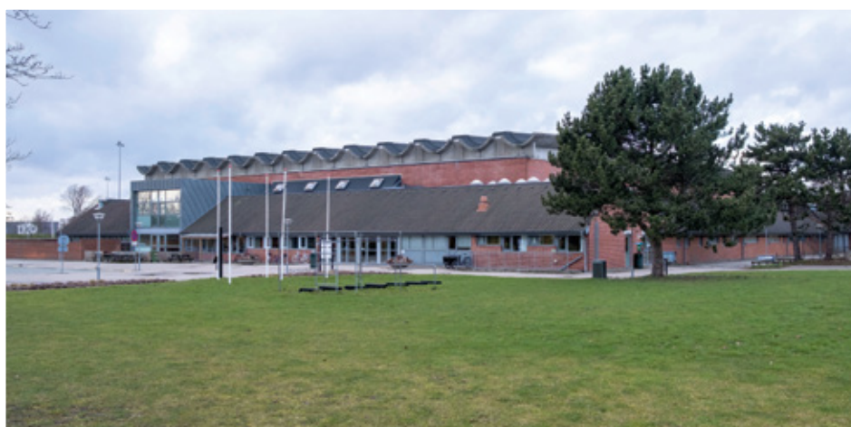
Sammen med Hvidovre, Brøndby, Ishøj og Greve vil Vallensbæk Kommune klimasikre Strandparken. Det er der også fundet penge til i 2027.