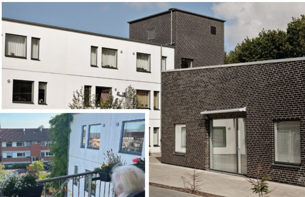
Daghjemmet på Højstruphøve bliver udvidet for 8,5 mio. kr.